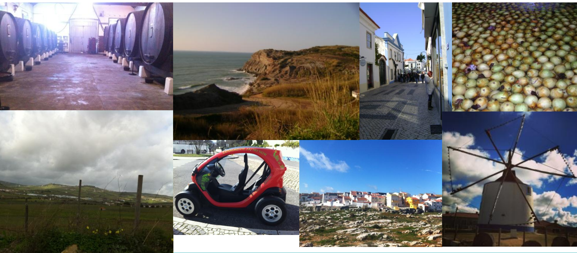
Imagens recolhidas nas visitas aos municípios