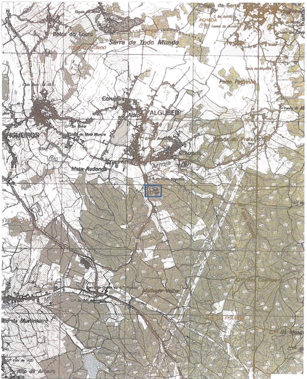
Extracto da Cartografia Raster Militar do Instituto Geográfico do Exército